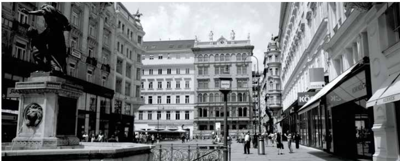
Kohlmarkt à Vienne, Autriche.

Avec G Croissance 2014, vous pouvez personnaliser votre investissement, la durée et la garantie en capital, selon vos projets et besoins.